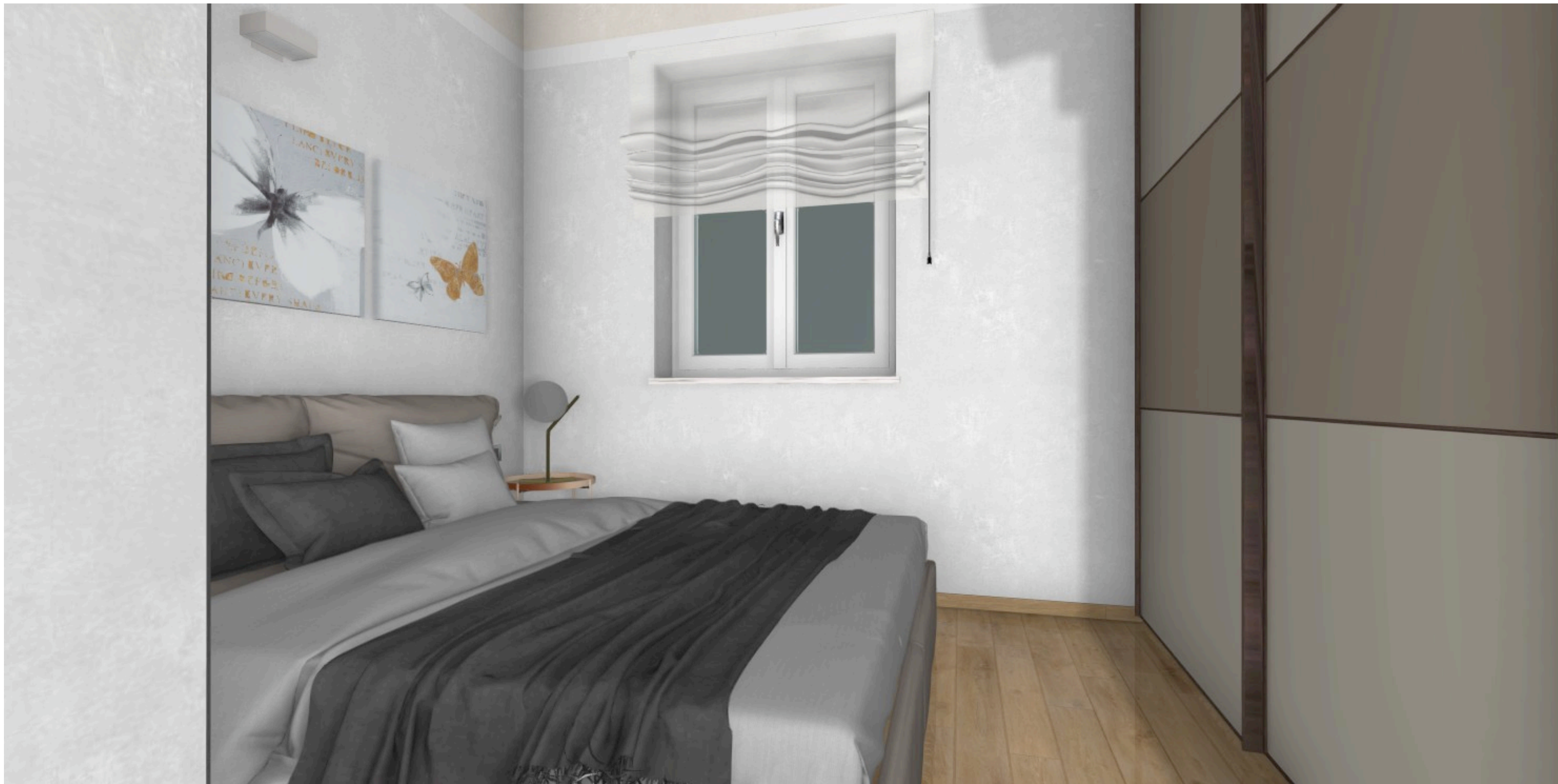
vista della camera da letto