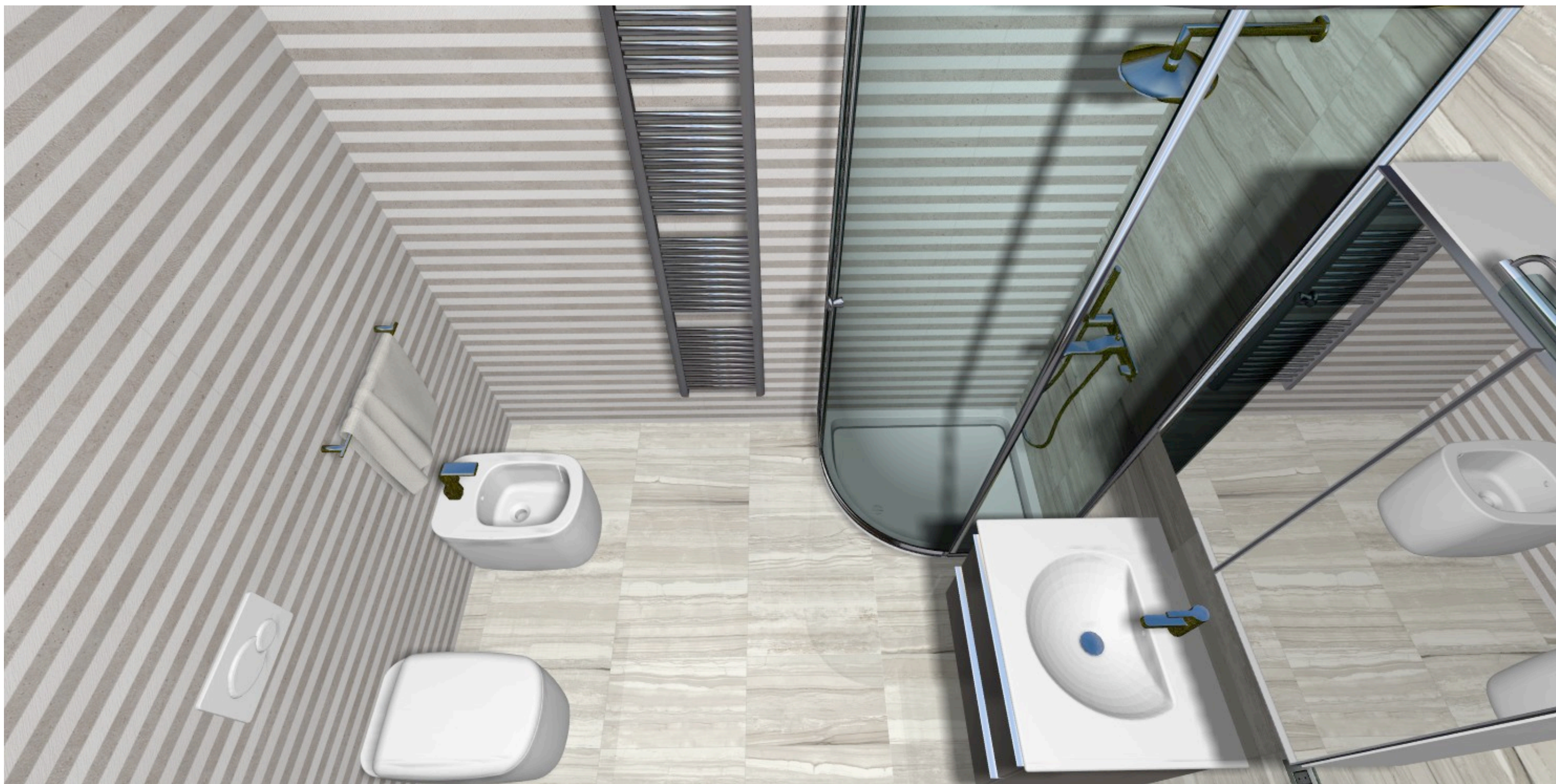
vista del bagno con doccia