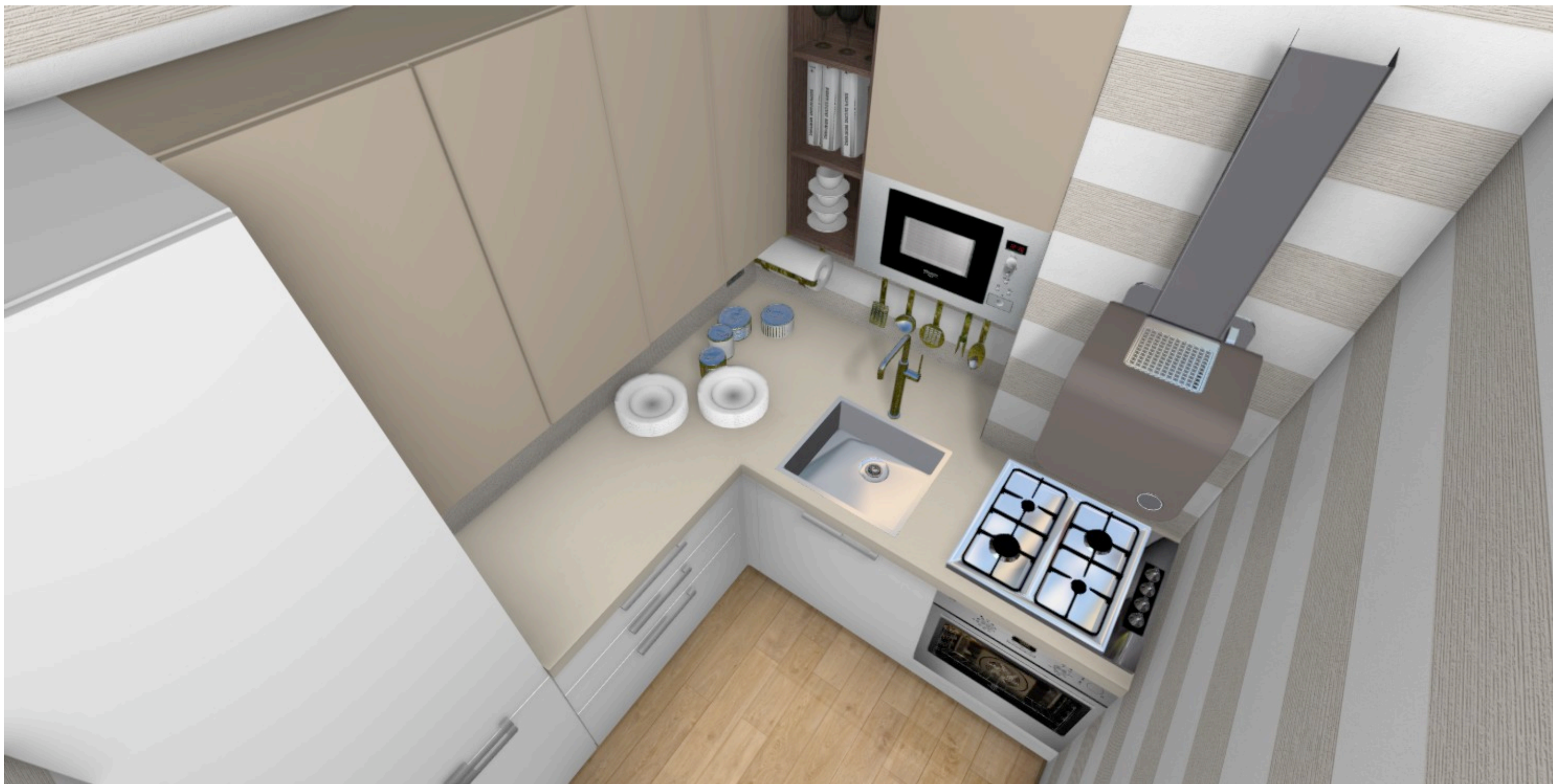
vista dell'angolo cottura