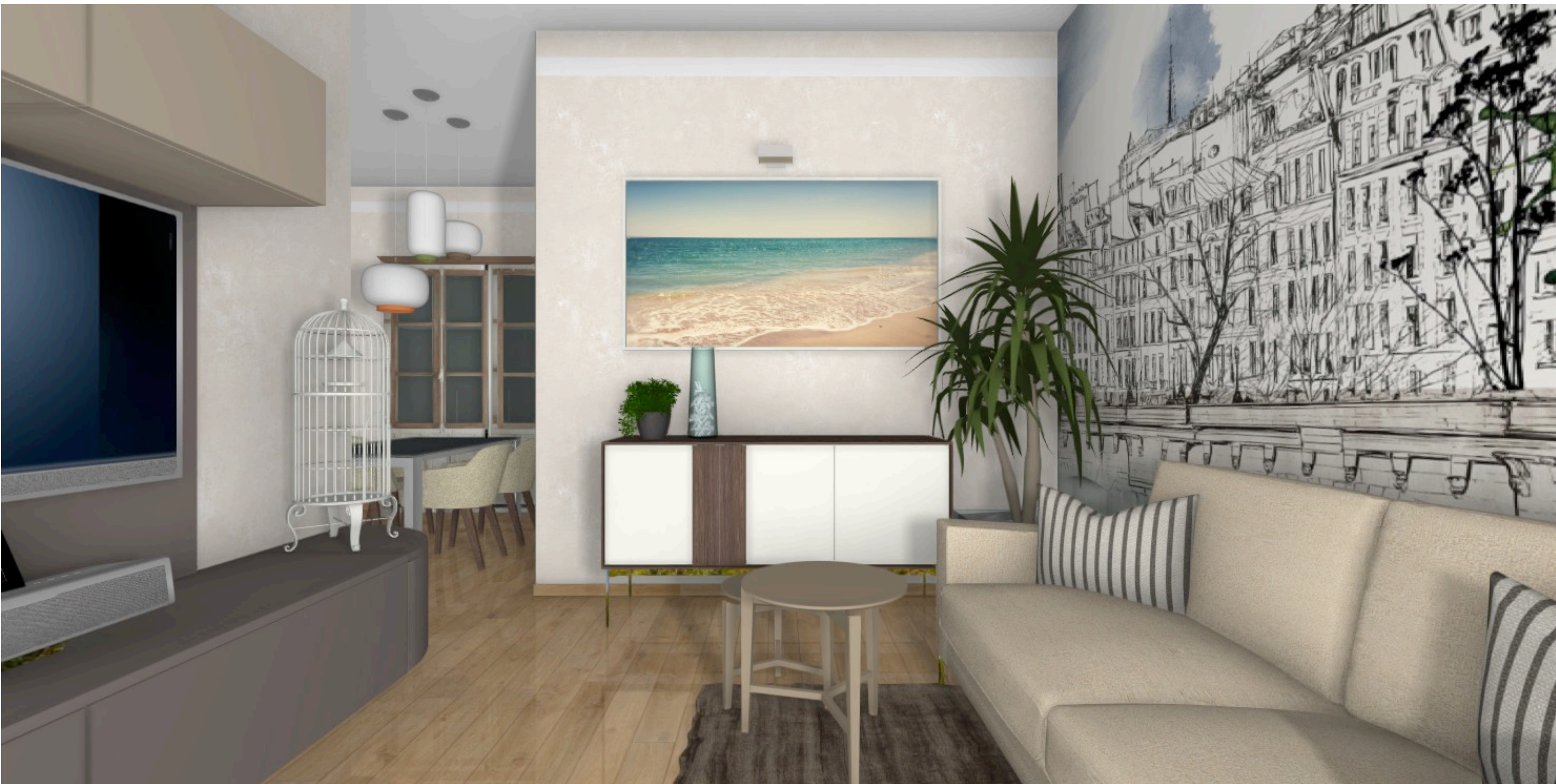
vista del vano soggiorno