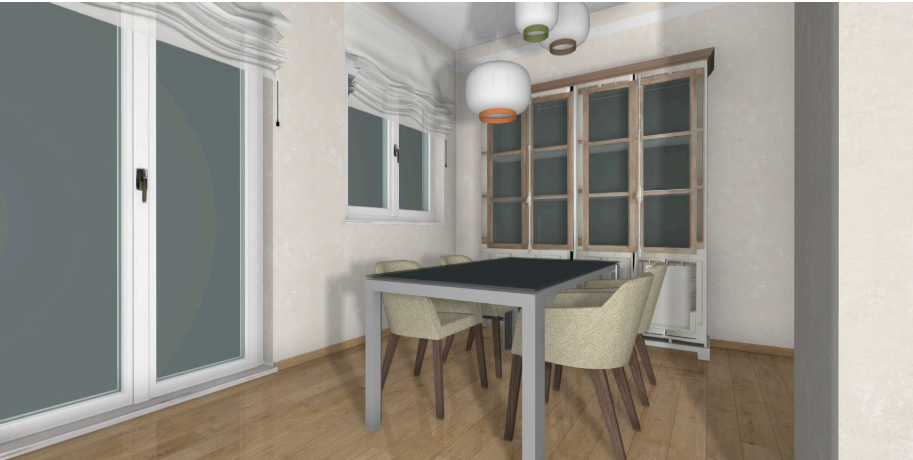
vista della zona pranzo