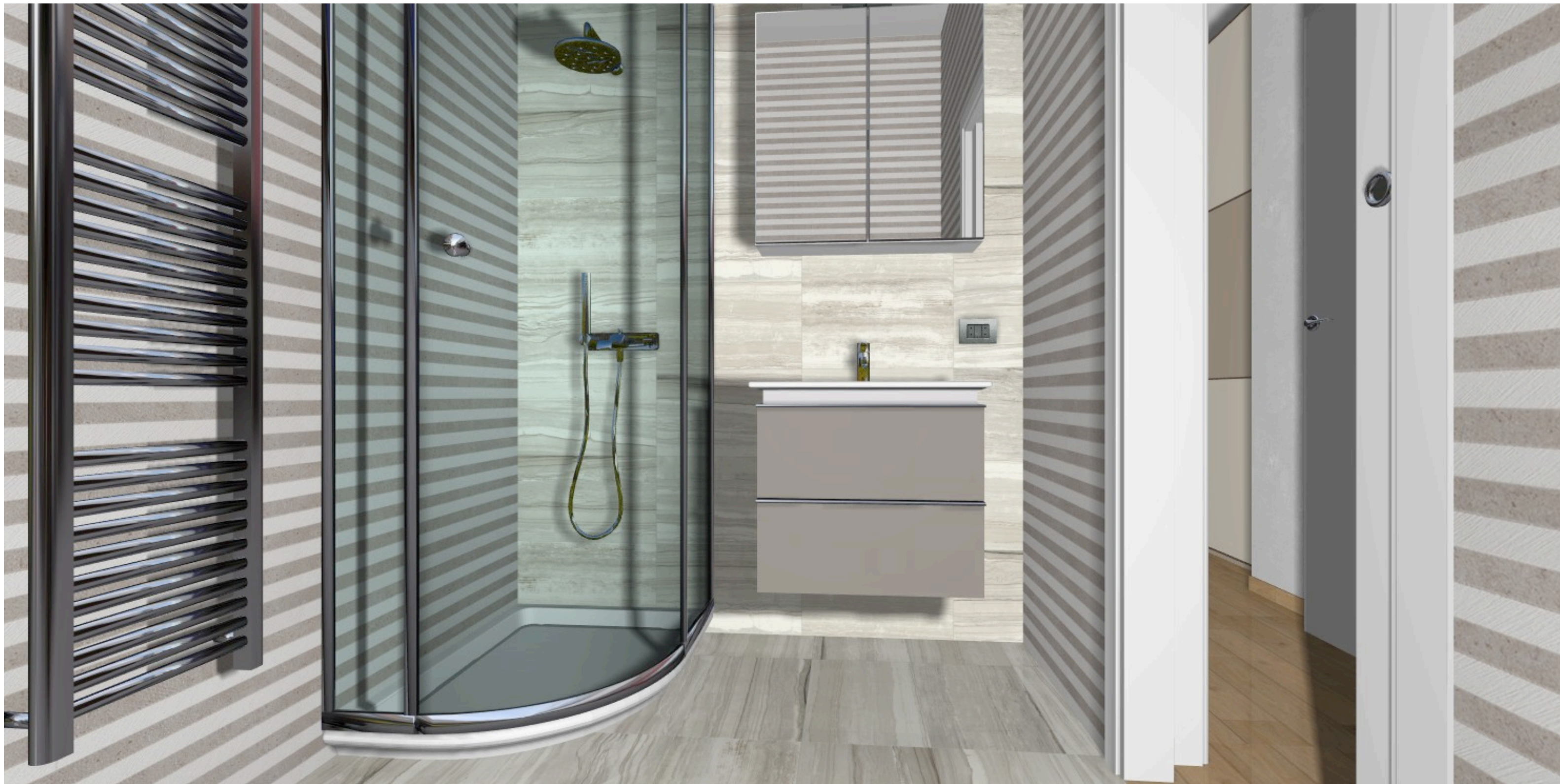
vista del bagno con doccia